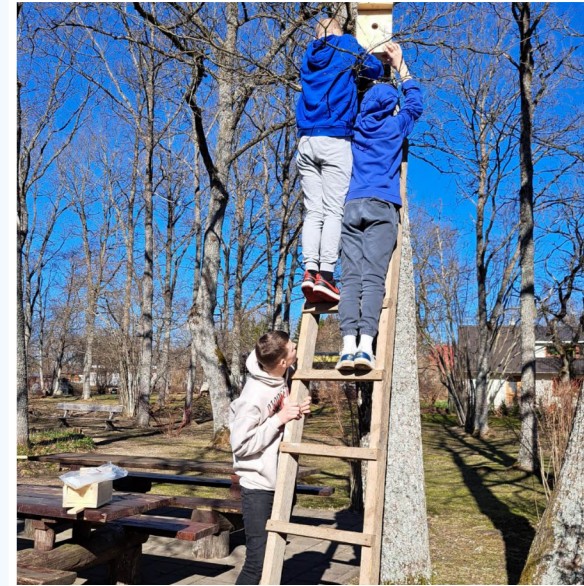
Pesakastide valmistamine, hooldus ja paigaldus.