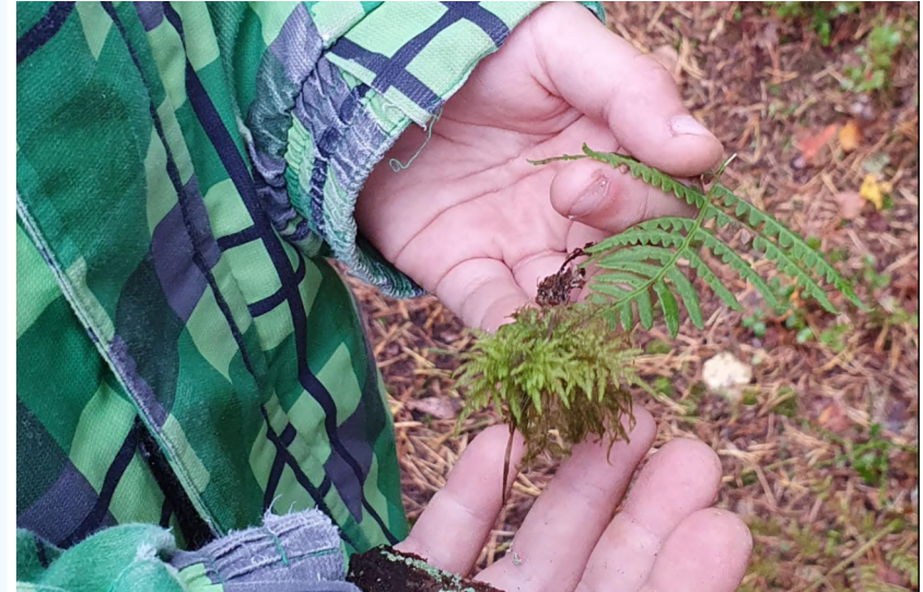
1. ja 3. klassi õuesõppepäev Viidumäel "Sammal, seen, sõnajalg"