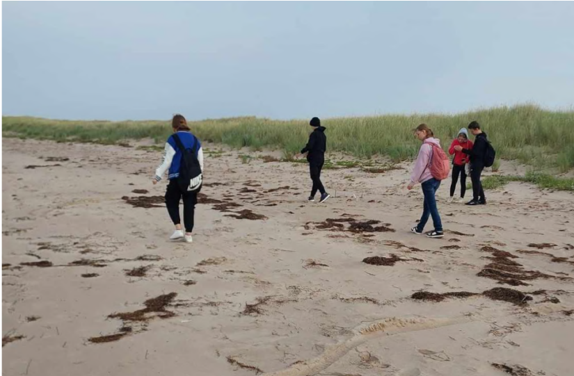
8. klass õuesõppepäeval Harilaiul