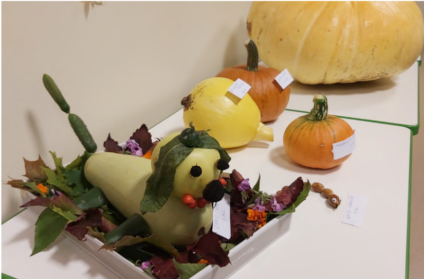
Koer ja kõrvitsad.